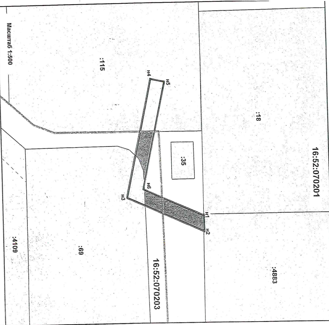
Схема границ публичного сервитута на кадастровом плане территории